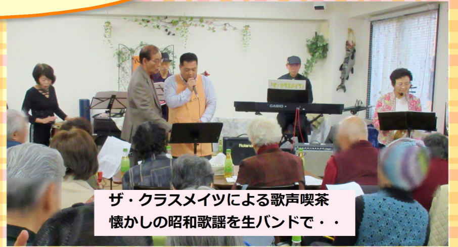
ザ・クラスメイツによる歌声喫茶 懐かしの昭和歌謡を生バンドで...