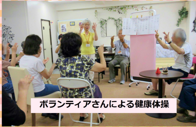
ボランティアさんによる健康体操