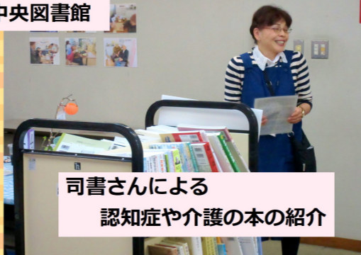
司書さんによる 認知症や介護の本の紹介