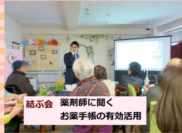
結ぶ会 薬剤師に聞く お薬手帳の有効活用