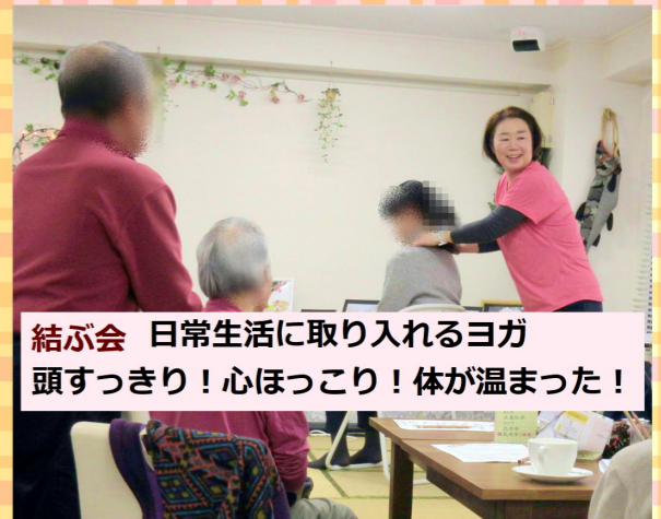
結ぶ会 日常生活に取り入れるヨガ 頭すっきり!心ほっこり!体が温まった!