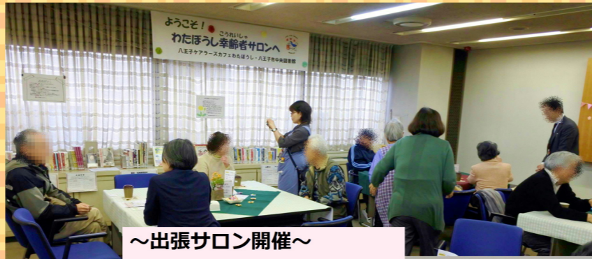
~出張サロン開催~ by 八王子中央図書館