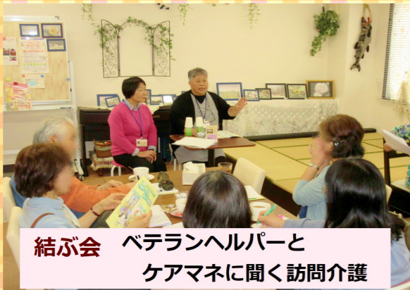
結ぶ会 ベテランヘルパーと ケアマネに聞く訪問介護