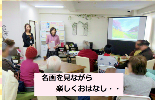
名画を見ながら 楽しくおはなし...