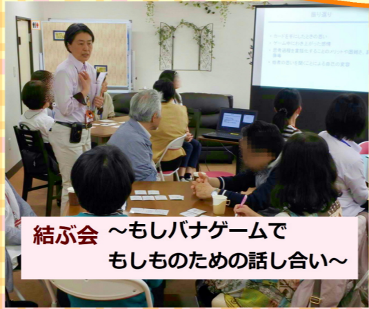
結ぶ会 ~もしバナゲームで もしものための話し合い~