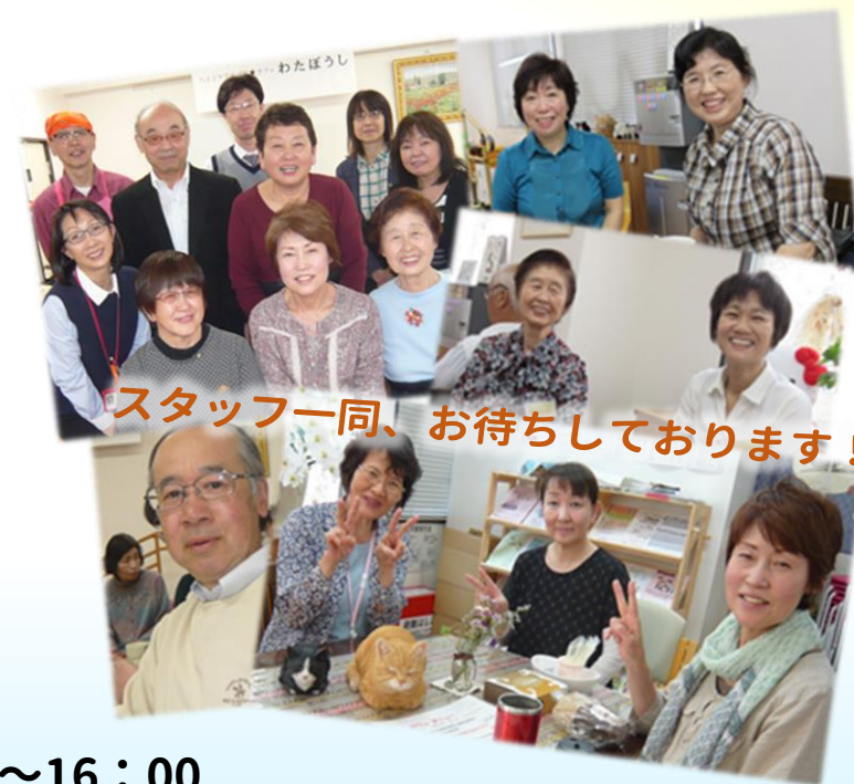
スタッフ一同、お待ちしております!

「わたぼうし」は、八王子市の介護者支援の一環として、今年2/14にオープンしました。ここでは、誰もが気軽に立ち寄れる、介護者や介護される方のためのカフェ(居場所)です。「介護者の方が日頃の“思い”を吐き出し、少しでもリラックスした時間を過ごしてほしい!」これが、私たちの思いです。スタッフには、介護者のOBや現介護者がいますので、一人で悩まず、安心してお話し下さい。おいしいお茶と、お菓子をご用意してお待ちしております。ぜひ、一度、足をお運びください!