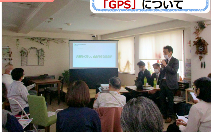
5/26【結ぶ会】GPS端末の使用による位置探索の性能や効果を知るための学習会を行いました