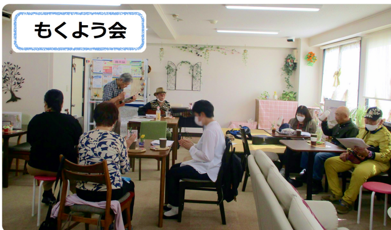
毎週木曜日 ギターやウクレレの演奏で 皆さんと歌を楽しんでいます♪♪ 本の読み聞かせもあります