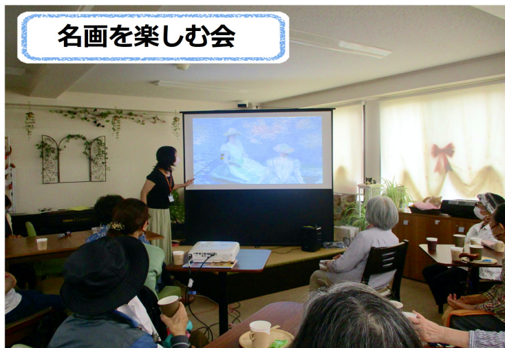
6/10【結ぶ会】絵を見て感じたことを自由に語り合い楽しみました

公式サイト https://www.koyasu-anshin.jp/wataboushi/